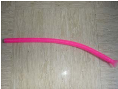
Tube sonore : Tube en plastique souple dentelé qui raisonne quand on le fait tourner en l'air, amplifie un son chuchoté ou gratté.