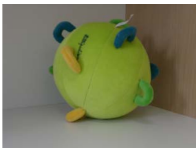
Balle à sons : Une balle musicale avec des poignées qui donnent envie de l'attraper. Elle émet 8 sons différents.