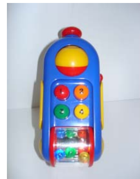
Téléphone portable : Divers sons selon les manipulations.