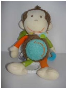
Peluche singe : Peluche avec boîte à musique intégrée