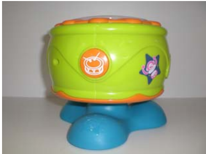
Tambour son et lumière : Instrument de musique qui offre une féérie de lumière. Entendez-le chanter et s'illuminer. Faites-le tourner sur lui et la mélodie s'accélère.