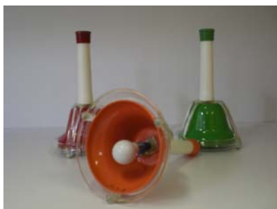
Clochettes musicales : 8 clochettes gamme diatonique : bleue (A6), violet (B7), 2 rouges (C1 et C8), orange (D2), jaune (E3), vert (F4), bleu turquoise (G5). A secouer et appuyer sur les embouts des manches pour jouer la note